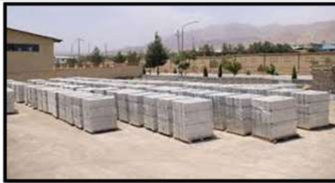
Reinforced Panel and Block, Gas Light Concrete and Dry Mortar