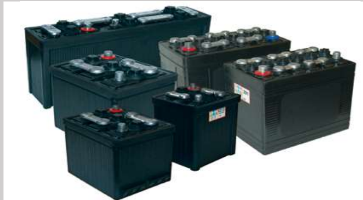
MF Auto battery