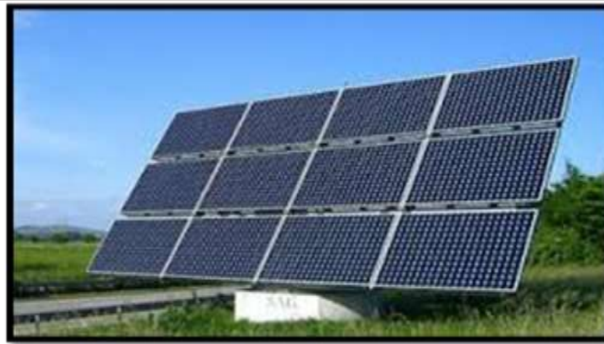
Solar panels made of Silicon Metal- Wafer and Solar Panel

Application: Energy consumption optimization as clean fuel and power supply