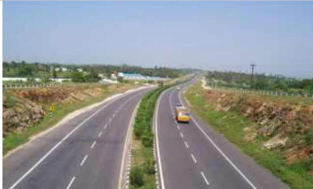
Khosravi-Kermanshah Freeway Construction

INVESTMENT OPPORTUNITIES IN KERMANSHAH PROVINCE