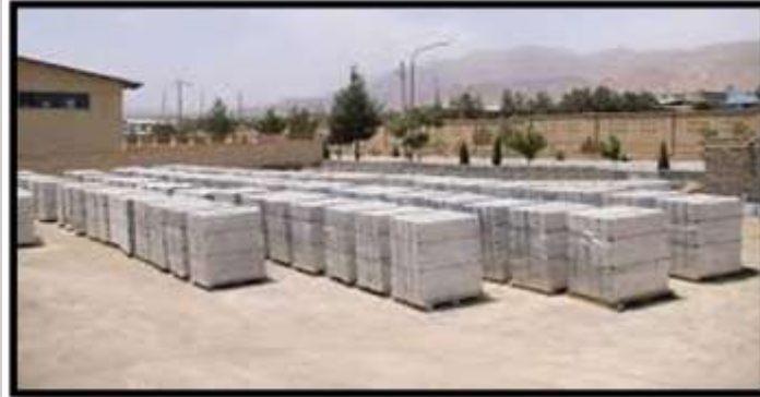
بلوک و پنل مسلح بتن سبک گازی

Investment Opportunities in Kermanshah Province