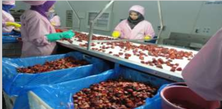
Fruit Freezing Unit (IQF)

INVESTMENT OPPORTUNITIES IN KERMANSHAH PROVINCE