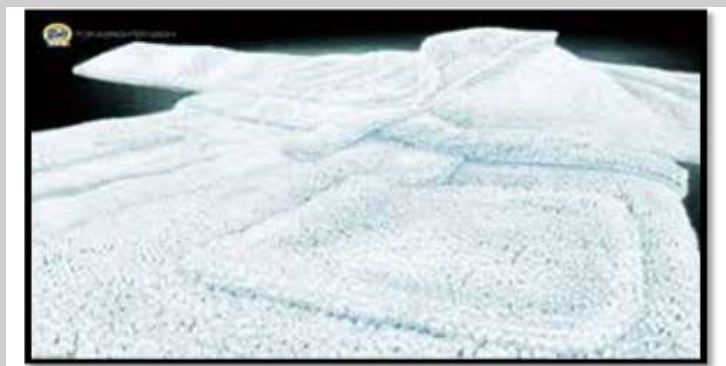
پودر شوینده و اسید سولفونیک