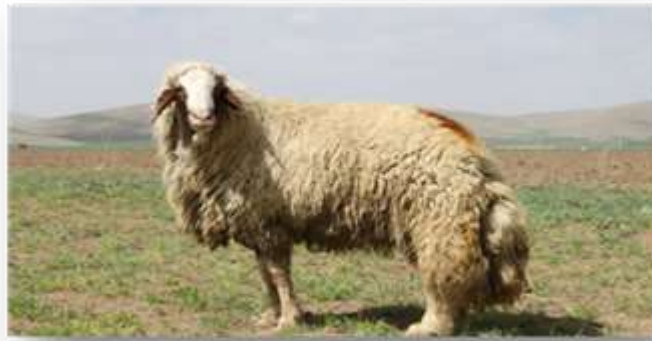
Construction of Animal Husbandry Complex (Bivanij)

INVESTMENT OPPORTUNITIES IN KERMANSHAH PROVINCE