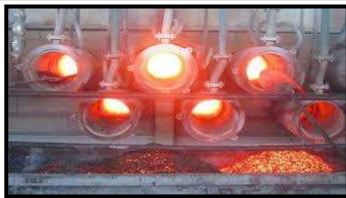
Producing magnesium ingots

Application: Magnesium ingots are used in automotive, aerospace, defense industries and aluminum alloys.