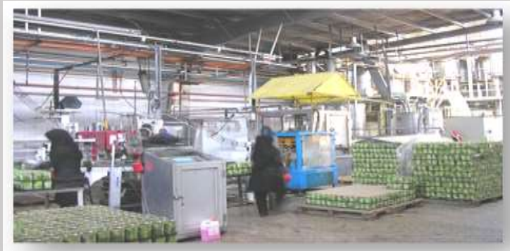
Construction of chickpea processing unit

INVESTMENT OPPORTUNITIES IN KERMANSHAH PROVINCE