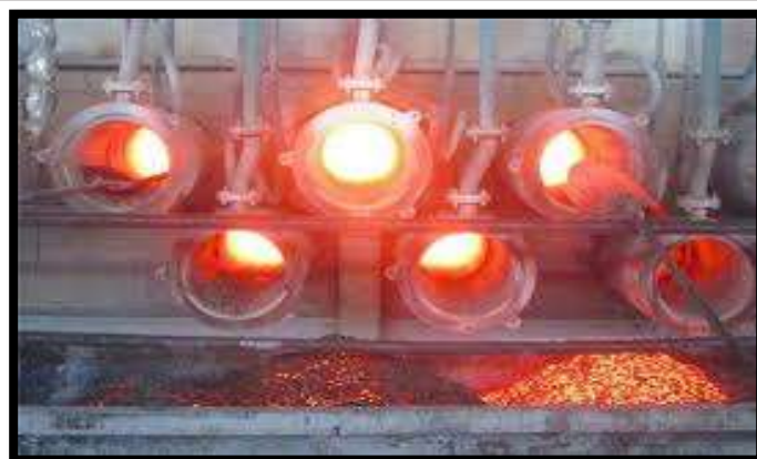
تولید شمش منیزیم