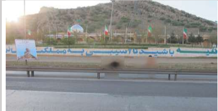
Mersad Resort Complex

INVESTMENT OPPORTUNITIES IN KERMANSHAH PROVINCE