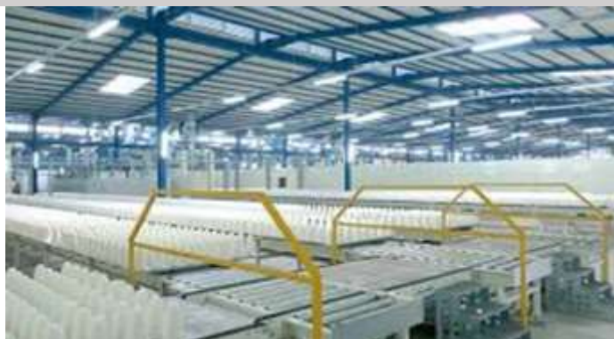
فراوری شکر (قند) از چغندر قند

Investment Opportunities in Kermanshah Province